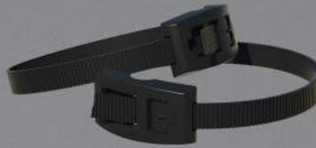
SMARTPAD Y HEBILLAS