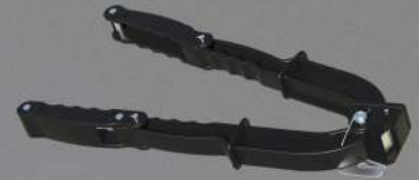
HERRAMIENTA DE TENSIÓN